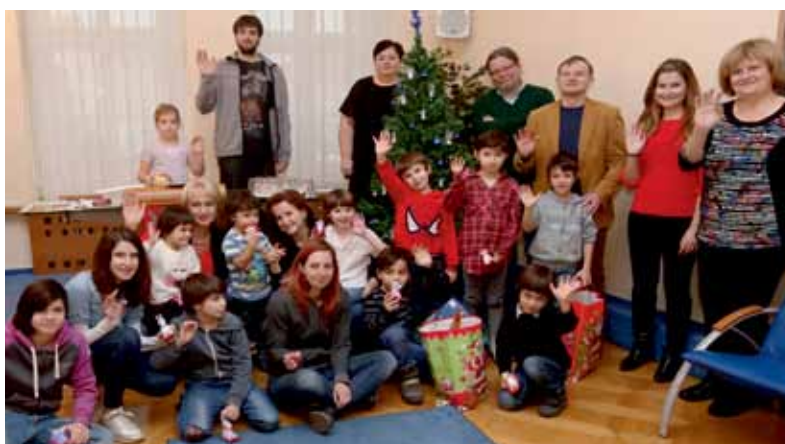
Děti z Klokánku u vánočního stromku v obřadní síni města.