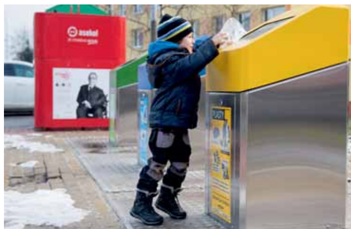
Nové podzemní kontejnery stojí v ulici M. Majerové.