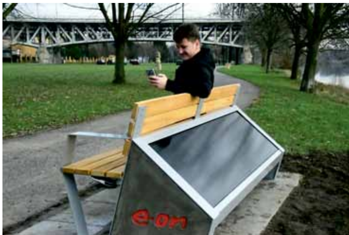
Druhá solární lavička je na Střeleckém ostrově u Labe.

Lavička dobíjí mobilní zařízení přes USB porty a nově také bezdrátově přes indukční dobíjení. Stejně tak poskytuje Wi-Fi připojení k internetu. Důležitá je její schopnost zaznamenat počet připojení, což poskytne zpětnou vazbu o využití. Náklady na pořízení a instalaci dosáhly 113 tisíc korun (bez DPH), avšak společnost E.ON, organizátor kampaně usilujících o instalaci solárních laviček, uhradila městu 75 procent nákladů.