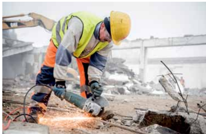
Bourací práce probíhaly v lednu za každého počasí.