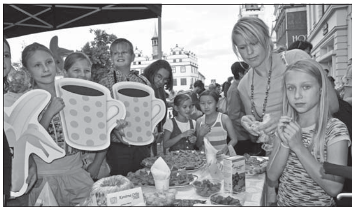
Přímo na náměstí mohly děti ochutnat fairtradové výrobky.

Litoměřice se tak zařadily po bok Londýna, Paříže, Bruselu a dalších měst, kterých je i s českými zástupci již 1005. Svým postojem dávají najevo podporu