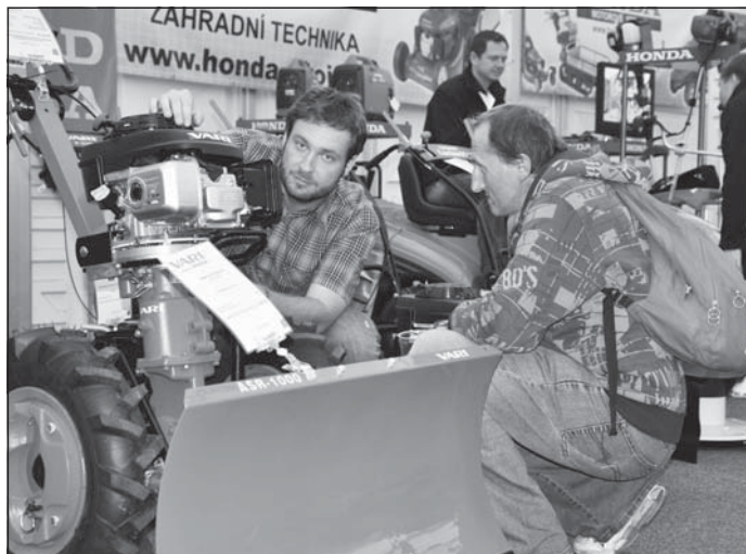
Zahradnický veletrh je nejnavštěvovanější akcí v roce. Mimo jiné i pro široký sortiment nabízené zahradnické techniky.

Hodnotící kritéria zastupitelé schválili na svém posledním zasedání. „Důraz hodláme klást