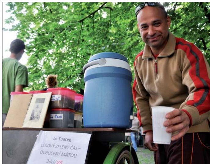
Vynikající čaje na speciálně uzpůsobeném vozítku nabízel ke koupi i ochutnání prodejce z Mělníku.