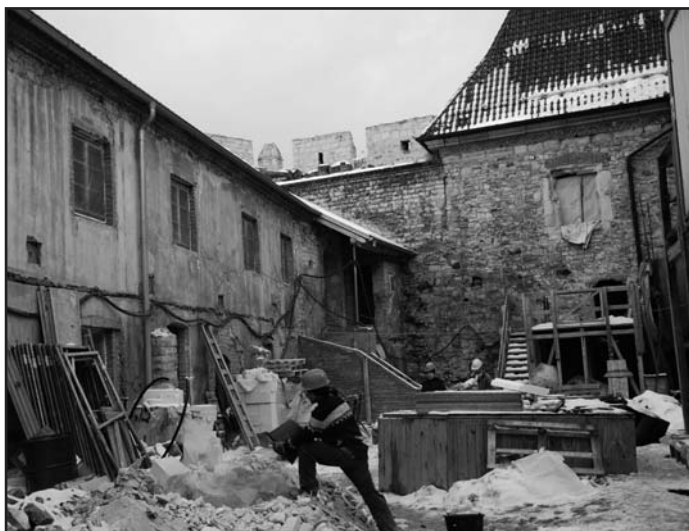
Z nádvoří hradu je zřejmé, jak čilý stavební ruch zde panuje. Objekt nalevo bude sloužit jako správní budova hradu, portálem v čele budou návštěvníci do hradu vstupovat.

Zchátralý gotický hrad se mění před očima. Firma Konstruktiva Konsit Praha totiž bude za několik málo měsíců končit první etapu přestavby této významné památky na „Svatostánek českého vinařství“.