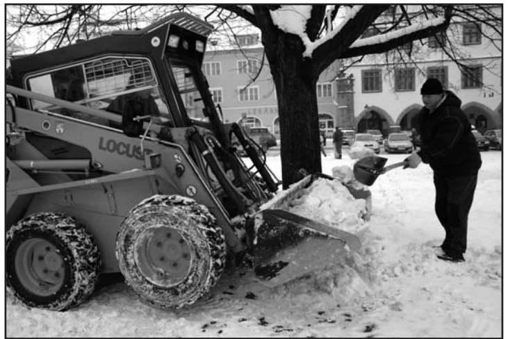
Pracovníci technických služeb nakládají na litoměřickém náměstí sněh a odvázejí ho k Labi.