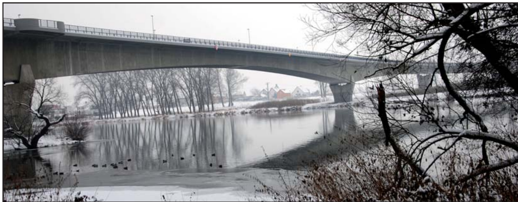
Most generála Chábery.