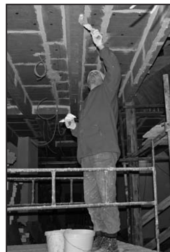
Vnitřek hradu zatím charakterizuje změť lešení, mezi nimiž se pohybují desítky dělníků.