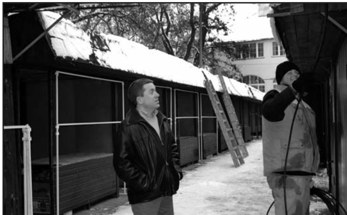
Místostarosta Tvrdík kontroloval průběh opravy rozvodu elektrické energie.

Již v první fázi nechala radnice opravit rozvody elektrické energie a řadu dalších opatření zrealizovala s cílem splnit bezpečnostní předpisy. „Dále chceme změnit vzhled stánků tak, aby je jako dosud nezakrývaly nevzhledné plachty. Zároveň jich ubude, protože některé jsou již dlouhodobě nevyužívané. Počítáme totiž s parkovými úpravami kolem hradeb tak, aby se stal z tržnice pří-