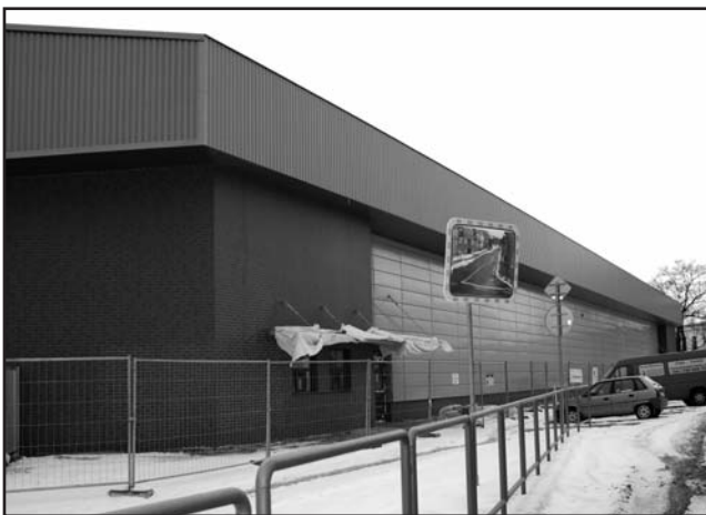
Modernizace zimního stadionu finišuje.

Neznamená to však, že Litoměřice mají více než dva set milionový úvěr. Patřily mezi nejlépe připravená města v kraji, díky čemuž získaly svým ob-