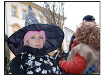
Do masopustního průvodu vycházejícího z náměstí od Gurmánie se loni zúčastnily i děti v maskách. Foto (eva)

13. února od 14 hodin litoměřický masopust.